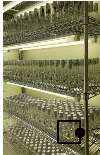
図5 カルスから 誘導したクローン