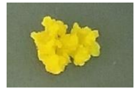
図4 クロユリのカルス